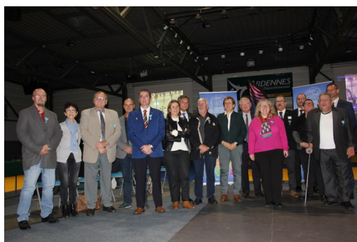
Promotions Argent 2023