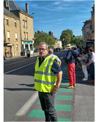
A nouveau, les signaleurs du CDMJSEA 08 ont assuré la sécurité au niveau de Mohon