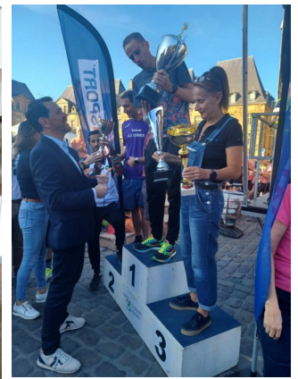
Remise des prix sur la place Ducale et réception au Musée de l'Ardenne